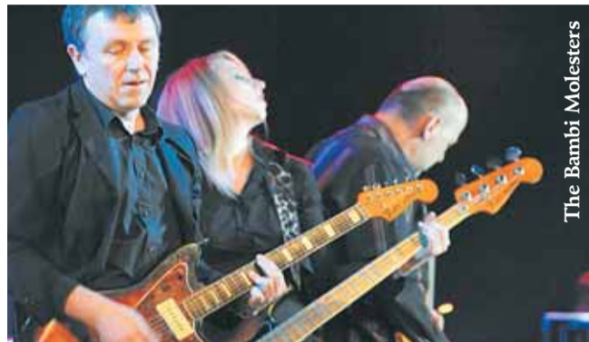
The Bambi Molesters

koncert sisačke instrumentalne surf-rock skupine četvrtak, 2. rujna u 20.30 sati