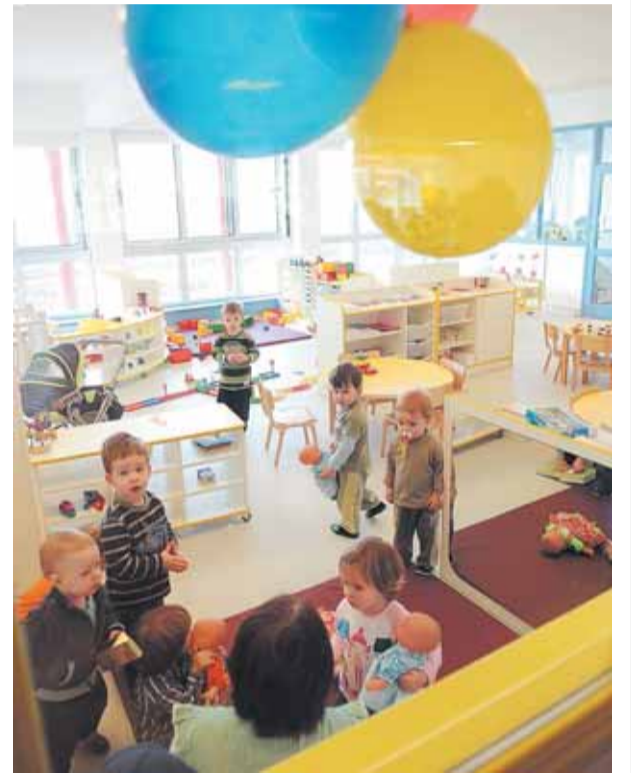
Dječji vrtić Drenova

U redovne programe integrirani su i pojedini specijalizirani programi koji su već postali standard riječkoga predškolskog odgoja. Pojedini su programi obogaćeni elementima waldorfske i reggio pedagogije, elementima programa »Korak po korak« kao i situacijskog i pristupa vrtiću po mjeri djeteta te »Vrtić dječja kuća«.